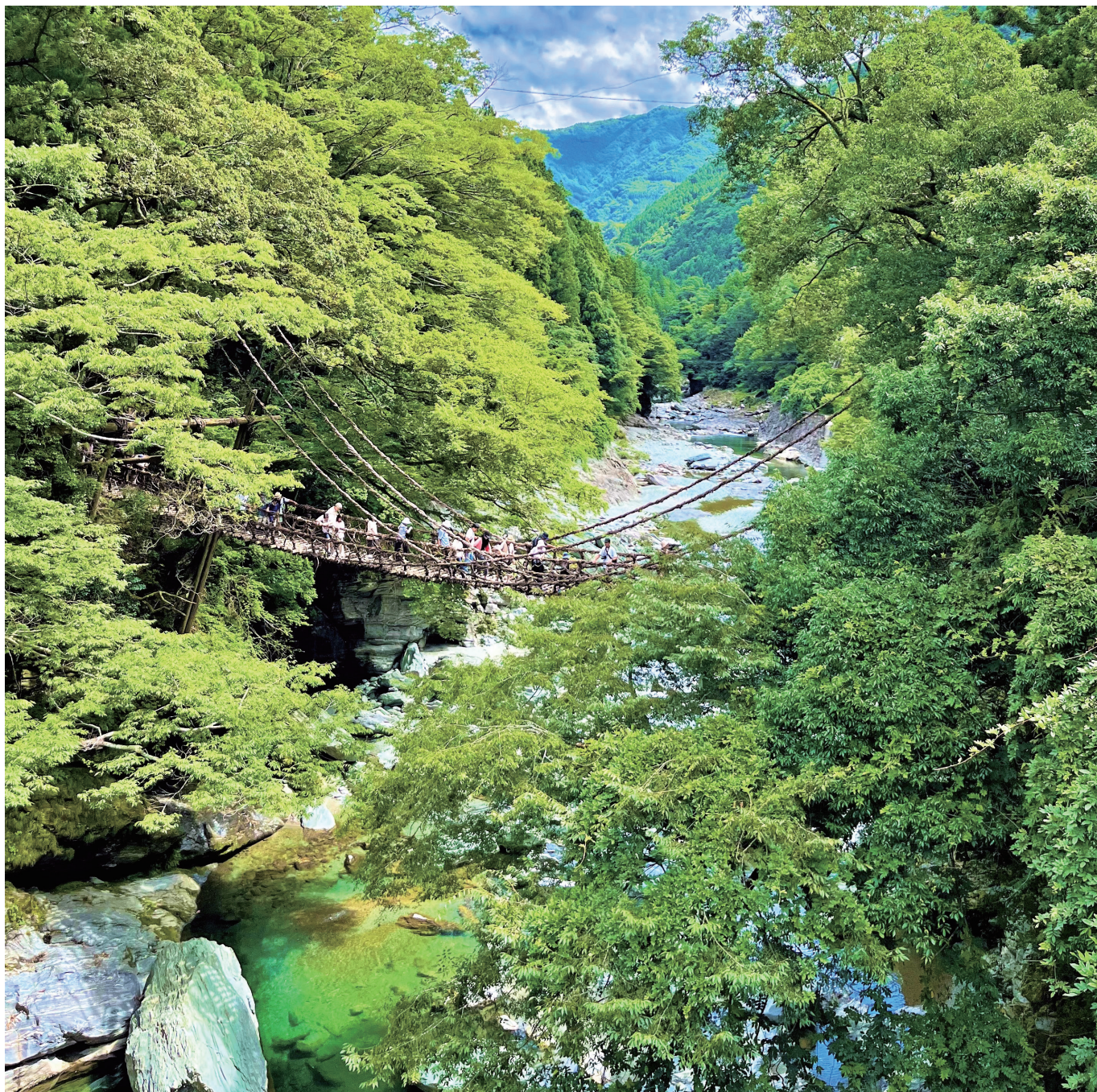
粗谷のかずら橋（徳島県三好市）