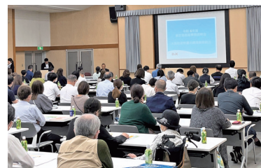
算定基礎届事務説明会の様子（6月19日開催）

なお、算定基礎届によって決定された新しい標準報酬月額が9月分保険料（10月告知）から適用されます。