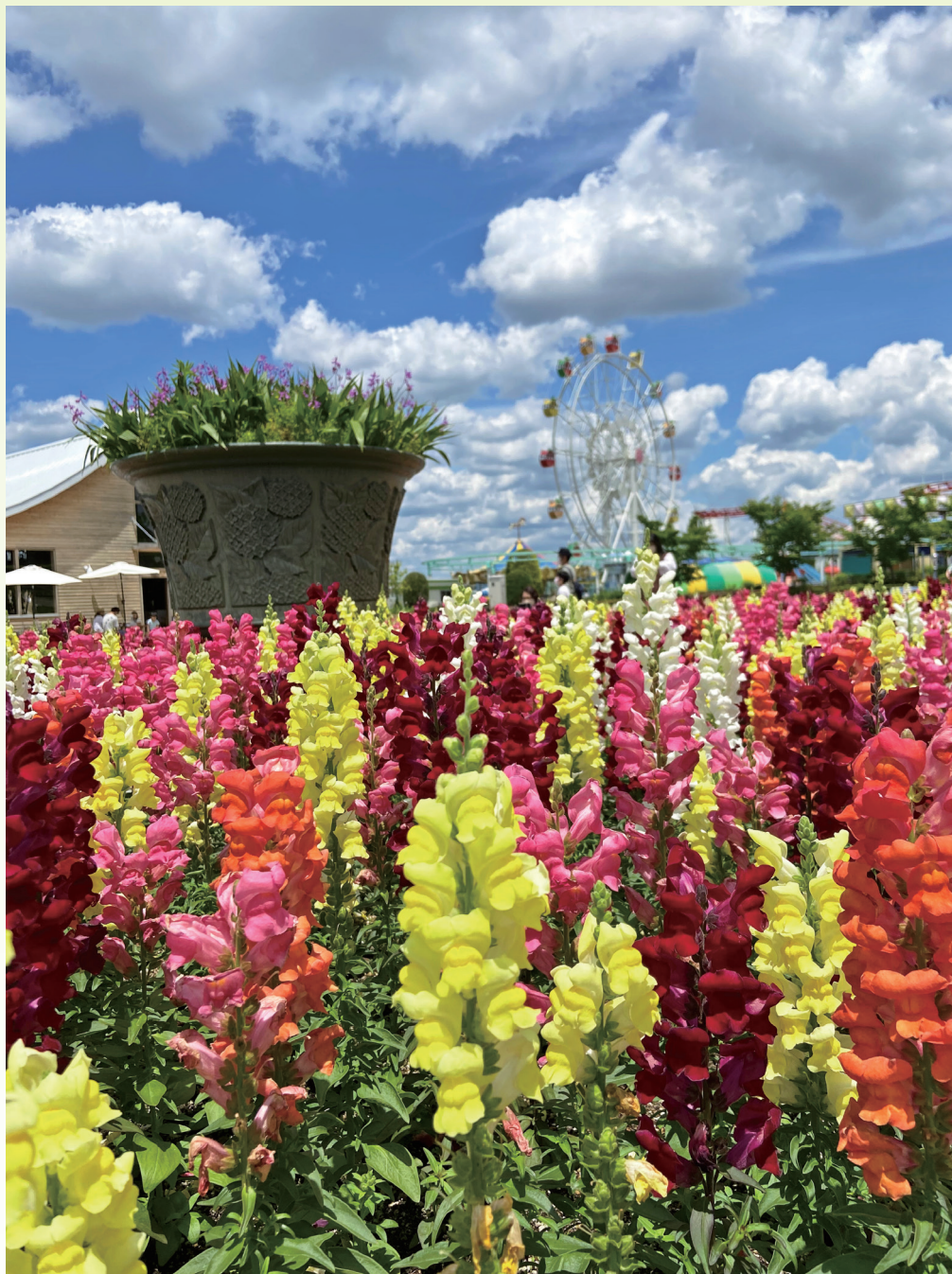
フルーツフラワーパーク (兵庫県)