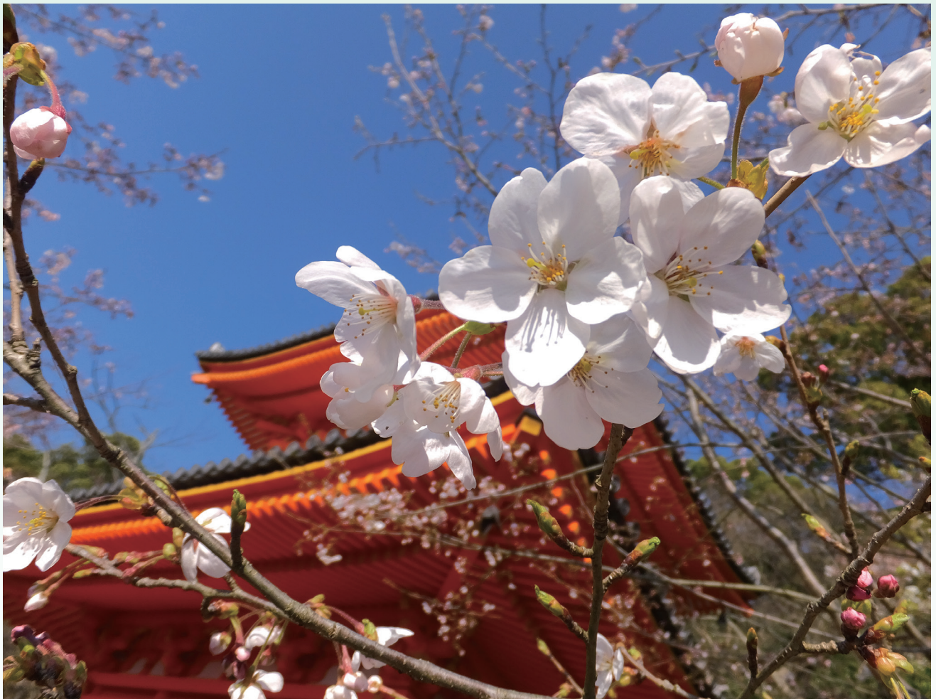
紀三井寺 (和歌山県)