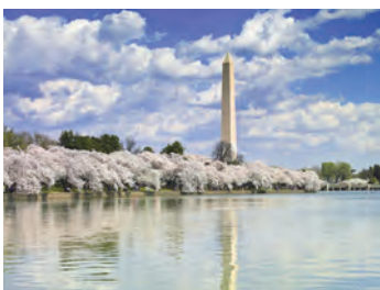
ポトマック河畔に咲く桜並木